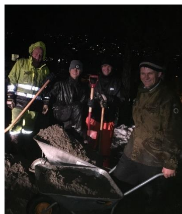
Dugnadsgruppen lager gangsti