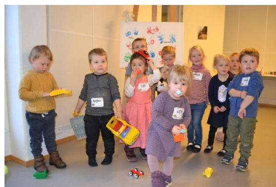
Bilde fra Barnefesten 2019

I 2019 ble 16 barn invitert, 10 barn var med på festen og 13 barn var med på Gudstjenesten. Vi planlegger å holde en småbarnsfest i året.