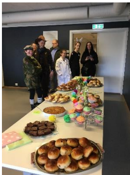
Kirkekaffe til karneval 2019

Festkomiteen består av to grupper med fem personer i hver gruppe. Disse har vært ansvarlige for to tilstelninger hver i 2019. Vi ønsker fortsatt flere som kan tenke seg å være med i gruppene. Festkomiteen har ansvar for bevertning til de store kirkekaffene.